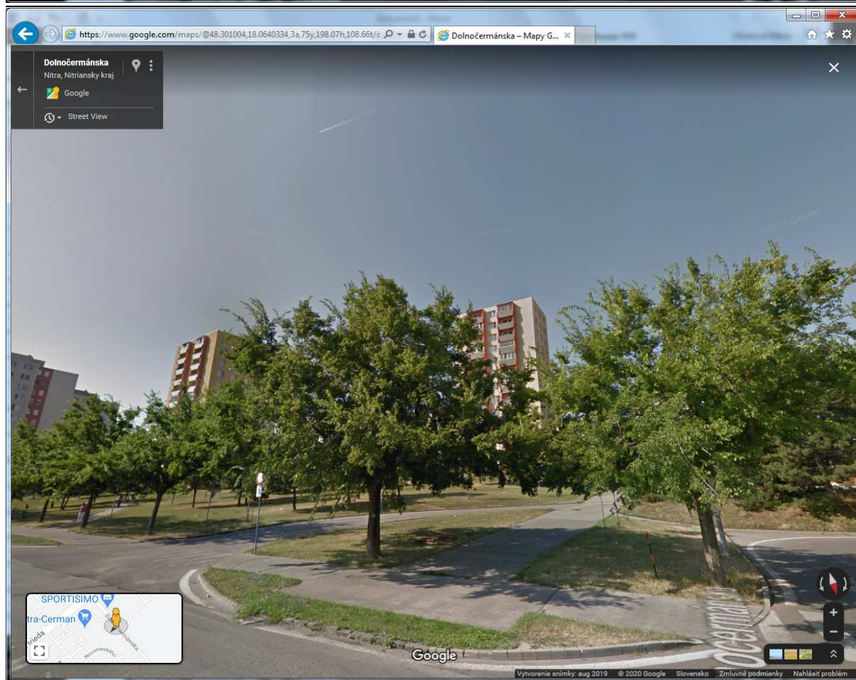
Google maps aug. 2019